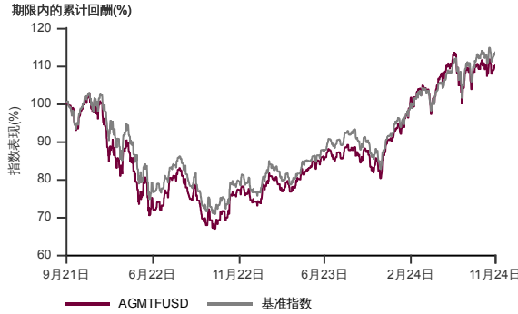
表现指标图截至2024年11月29日*

2021年8月至2024年11月 净资产值 - 净资产价格和假设收入再投资到基金, 其总投资是以美元为基础。基金价格和收益(视情形而定)随时波动 过去表现不应视为未来表现的准则。