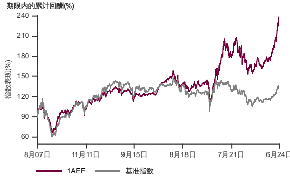
表现指标图截至2024年6月28日*

2007年8月至2024年6月 净资产值 - 净资产值价格和假设收入再投资到基金，其总投资是以马币为基础。基金价格和收益(视情形而定)随时波动 过去表现不应视为未来表现的准则。