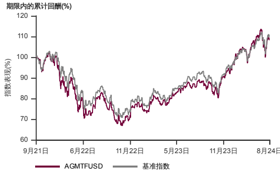
表现指标图截至2024年8月31日*

2021年8月至2024年8月 净资产值 - 净资产价格和假设收入再投资到基金, 其总投资是以美元为基础。基金价格和收益(视情形而定)随时波动 过去表现不应视为未来表现的准则。